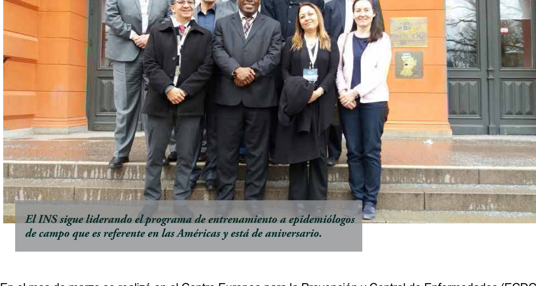
El INS sigue liderando el programa de entrenamiento a epidemiólogos de campo que es referente en las Américas y está de aniversario.

En el mes de marzo se realizó en el Centro Europeo para la Prevención y Control de Enfermedades (ECDC, por sus siglas en inglés) en la ciudad de Estocolmo, Suecia, la reunión del Consejo Consultor de TEPHINET que define lineamientos, objetivos y estrategias para el Programa de Entrenamiento en Epidemiología de Campo FETP en los 90 países en el que se desarrolla.