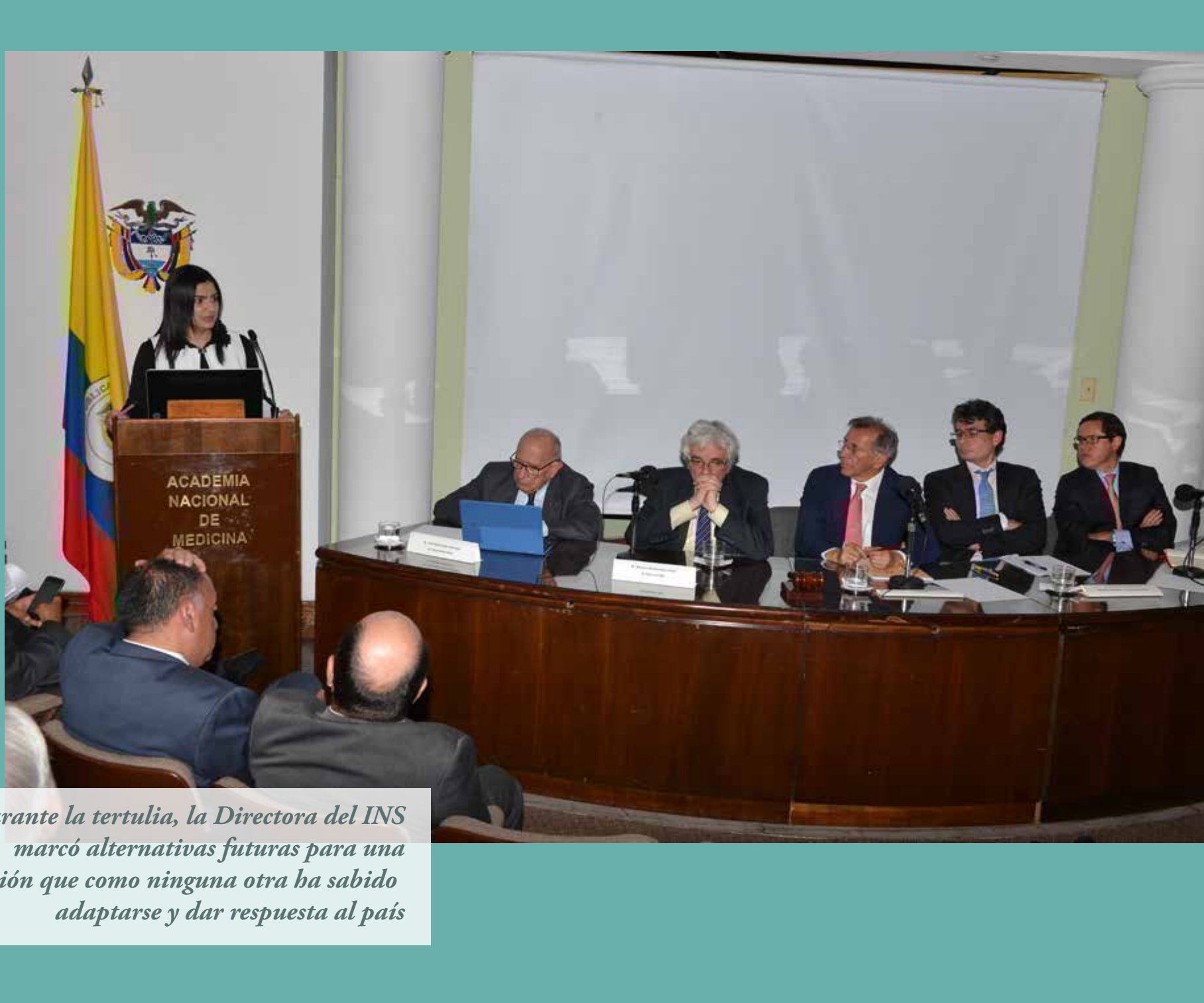
Durante la tertulia, la Directora del INS marcó alternativas futuras para una Institución que como ninguna otra ha sabido adaptarse y dar respuesta al país

Al cierre de la tertulia, la directora del INS señaló algunas de las alternativas futuras de la Institución, señalando que es más justo para el INS que pueda ser una entidad docente, al respecto indicó: "por los corredores del Ins, los laboratorios del INS, han pasado todos los que han hecho doctorados en ciencias en Colombia, cientos de magisters, estudiantes de postgrado, con sus insumos y en sus laboratorios se han formado miles de estudiantes".