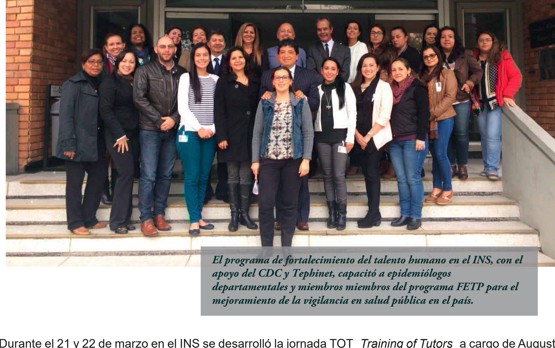
El programa de fortalecimiento del talento humano en el INS, con el apoyo del CDC y Tephinet, capacitó a epidemiólogos departamentales y miembros del programa FETP para el mejoramiento de la vigilancia en salud pública en el país.