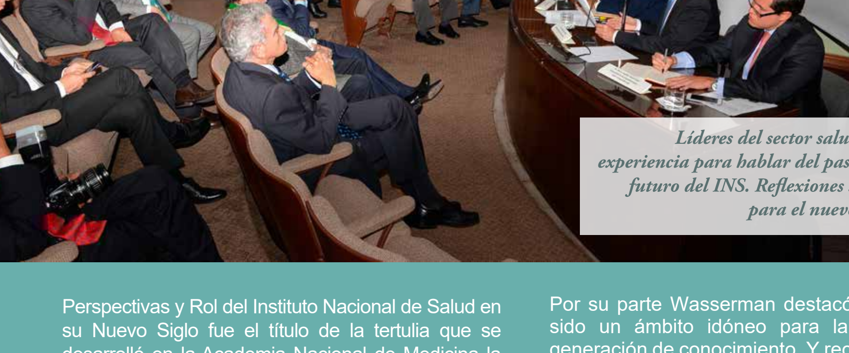
Líderes del sector salud aportaron su experiencia para hablar del pasado, presente y futuro del INS. Reflexiones serán el rumbo para el nuevo siglo del INS.

Consulte el contenido completo de la Tertulia en youtube con el nombre Perspectivas y Rol del Instituto Nacional de Salud en el Nuevo Siglo