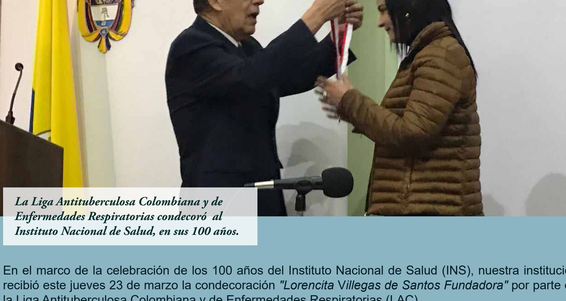
La Liga Antituberculosa Colombiana y de Enfermedades Respiratorias condecoró al Instituto Nacional de Salud, en sus 100 años.

En el marco de la celebración de los 100 años del Instituto Nacional de Salud (INS), nuestra institución recibió este jueves 23 de marzo la condecoración "Lorencita Villegas de Santos Fundadora" por parte de la Liga Antituberculosa Colombiana y de Enfermedades Respiratorias (LAC).