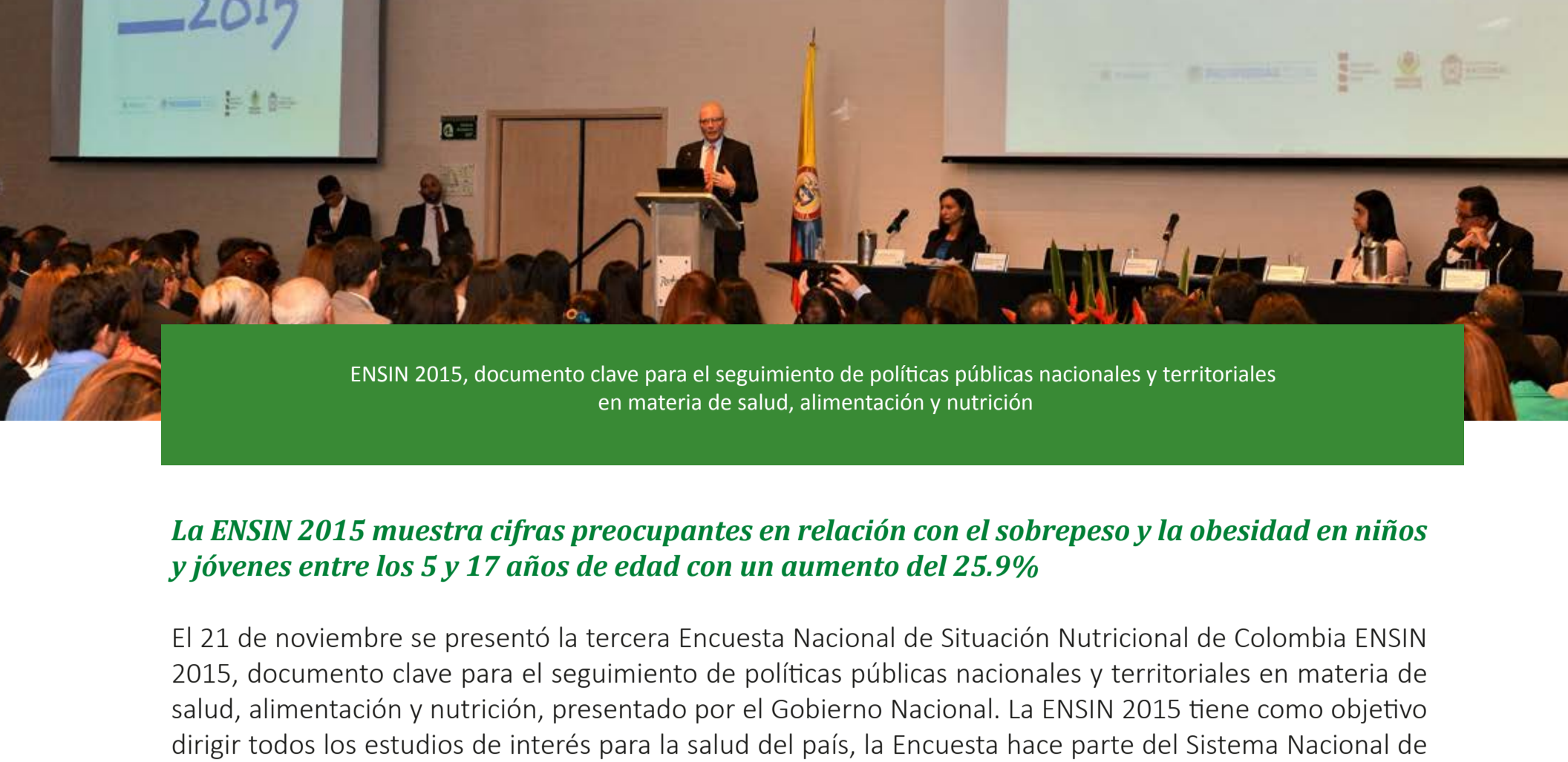
ENSIN 2015, documento clave para el seguimiento de políticas públicas nacionales y territoriales en materia de salud, alimentación y nutrición