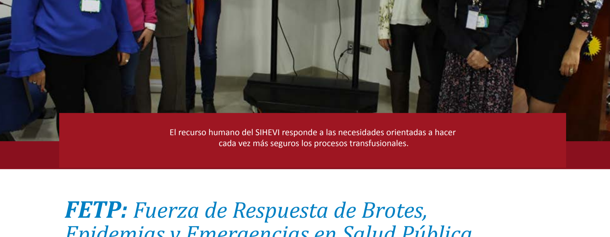
El recurso humano del SIHEVI responde a las necesidades orientadas a hacer cada vez más seguros los procesos transfusionales.

El SIHEVI responde a las necesidades actuales orientadas a hacer cada vez más seguros los procesos transfusionales al permitir que los bancos de sangre puedan comunicarse entre ellos con lo que se mejora la selección de donantes, y permite mejorar la práctica de la medicina transfusional al poder identificar a los receptores de sangre que han tenido reacciones adversas previas; además hace que Colombia como pionera en soluciones informáticas, espere que a través de convenios de cooperación internacional se logre que otros países puedan adoptar esta aplicación, y lograr que todos los países puedan compararse con indicadores homologados. No solo se logra contar con un sistema de información que permita medir la gestión, sino que permite trazar el destino final de cada unidad de sangre captada en el país. Pese a que en la actualidad tenga tantos módulos desarrollados, surgen ahora nuevos retos respecto a la información que se quiere recolectar.