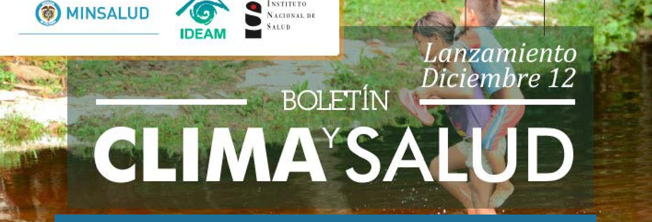
Después del 2030 y en un periodo de 20 años, el cambio climático habrá causado 250 mil nuevas muertes por año

Por primera vez en alianza intersectorial el Instituto Nacional de Salud (INS) y el IDEAM, con el apoyo del Ministerio de Salud y Protección Social, trabajan conjuntamente las predicciones climatológicas y de vigilancia epidemiológica para presentar en un Boletín el impacto del clima en la salud de los colombianos. Conocer las alertas para el mes en materia de clima y sus consecuencias para la salud, desde ahora es posible gracias al Boletín Clima y Salud, un documento que presenta por cada una de las regiones de Colombia, las predicciones en materia de vigilancia en salud pública y en climatología (lluvias y temperatura).