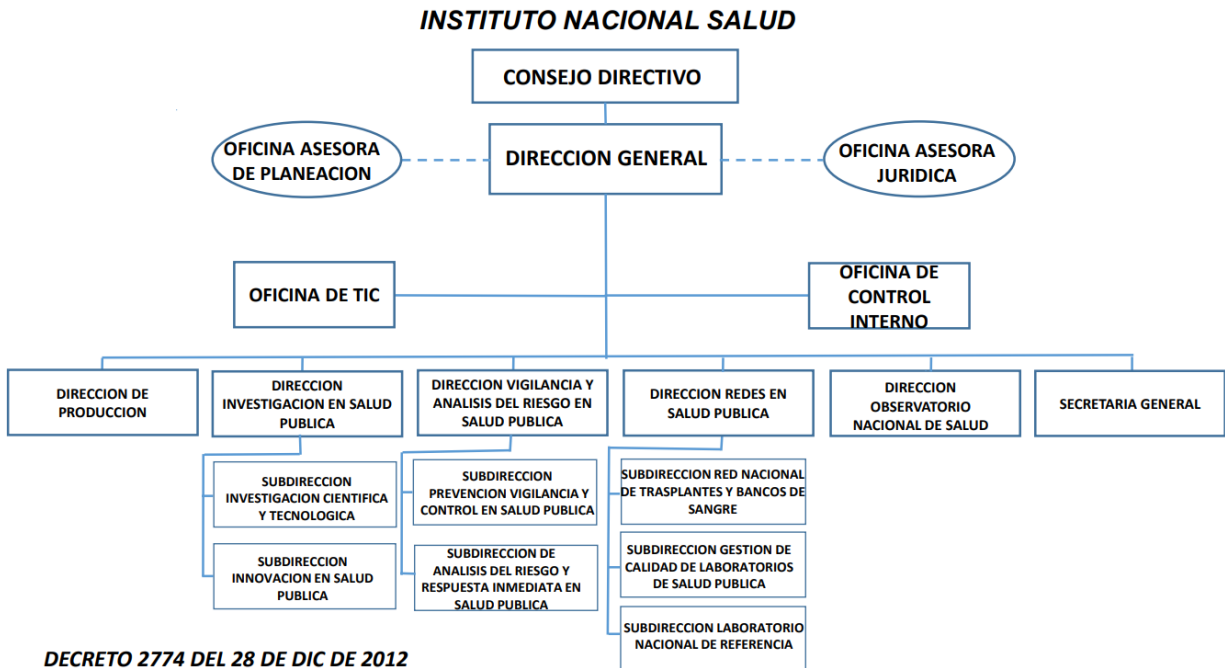
Gráfica 2. Organigrama INS – Intranet