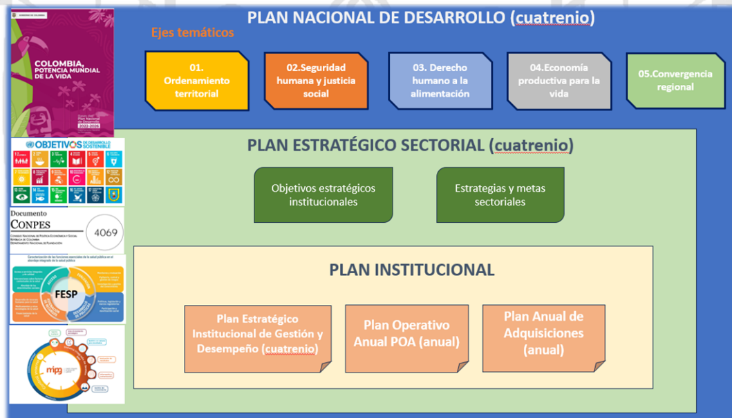
Gráfica No.1 Alineación de la plataforma estratégica INS

La formulación estratégica del INS estará articulada al Plan Nacional de Desarrollo, la planeación sectorial, y se complementa con los lineamientos y parámetros del Modelo Integrado de Planeación y Gestión – MIPG, los objetivos de desarrollo sostenible, Funciones Esenciales de Salud Pública y el CONPES 4069 (2022-2031) el cual contiene la nueva Política Nacional de Ciencia, Tecnología e Innovación que nos indica la hoja de ruta en materia de Ciencia, Tecnología e Innovación para la próxima década.