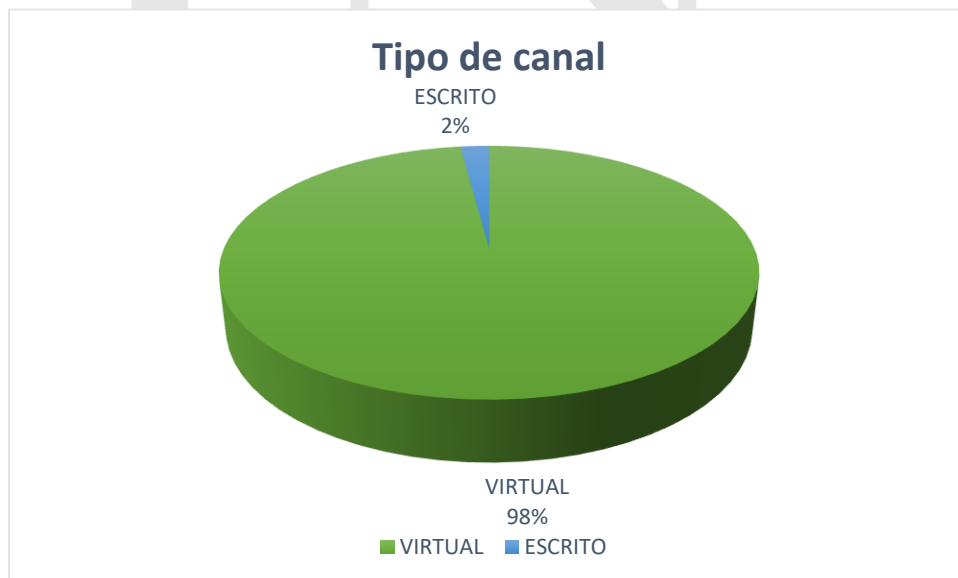
GRÁFICA 2. TIPO DE CANAL DE PQRSDf

La gráfica siguiente ilustra la cantidad de PQRSDf recibidas por canal de ingreso, junto con su respectivo porcentaje, durante el período comprendido entre el 1 de abril y el 30 de junio de 2025. Se observa que el canal más utilizado por los ciudadanos es el virtual con un 97,95 %, lo que equivale a 1000 solicitudes, seguido del canal escrito, que representa el 2,05 % con 21 solicitudes. No se registraron solicitudes a través del chat, telefónicas o de manera presencial.