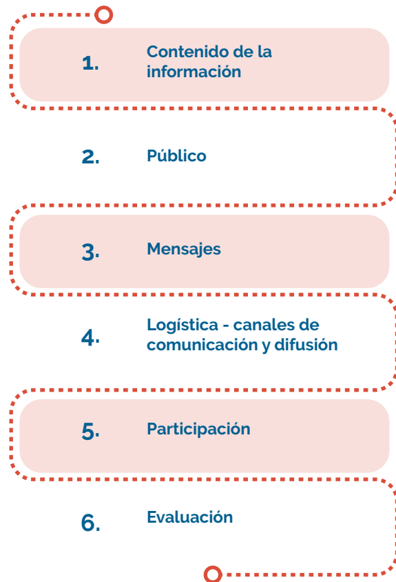
Figura 1. Elementos clave – Comunicación del riesgo en el marco de la preparación y respuesta ante brotes, epidemias y eventos de interés en salud pública.

Fuente: Adaptado de: Sandman, P. Comunicación de crisis: una introducción muy rápida (4)