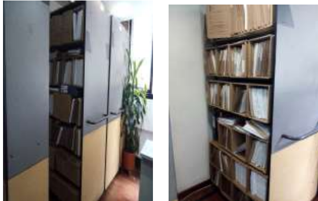
Figura No 4: Documentación de la Oficina Jurídica