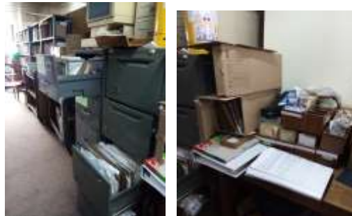
Figura No 19: Documentación de Biblioteca

Nota. En el momento de la visita, se encontró en uno de los archivadores un paquete de documentos a los cuales no se les encontró fecha para la descripción dentro del diagnóstico