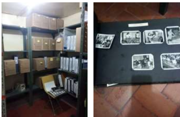
Figura No 14: Documentación del Grupo de Salud Ambiental y Laboral

El grupo menciona, que, dentro del Instituto Nacional de Salud, no se encuentra documentación en otra parte del INS, toda la documentación presta el servicio de consulta, su principal característica es papel, por último, el grupo señala que las condiciones del depósito no son aceptables para mantener, conservar y preservar la documentación debido a que no está constituido como archivo por falta de estantes, iluminación y ventilación.