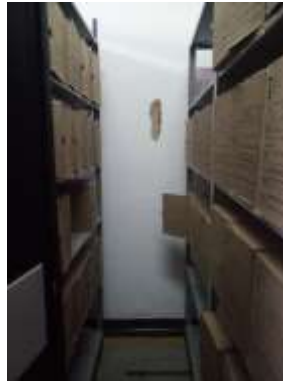
Figura No 24: Documentación de Grupo Entomología Red

Nota: Este depósito es compartido con el grupo de Entomología Investigación