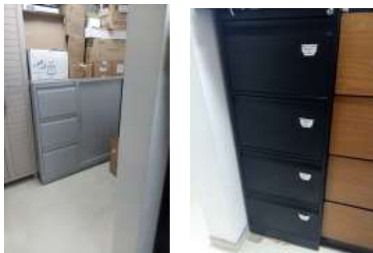
Figura No 15: Documentación del Grupo Salud Materna

Cabe resaltar en total en el Grupo de Salud Materna y Perinatal por medio de sus depósitos distribuidos en el INS conserva 9.75 metros lineales, entre las diferentes unidades de conservación