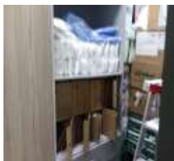
Figura No 34: Documentación de Grupo de COE

Nota. Cabe mencionar, que el depósito en donde mantiene la documentación también se encuentran otros elementos como el de papelería cajas de gran tamaño y demás materiales, se considera que por parte de grupo de gestión documental el espacio no es suficiente para mantener los documentos