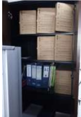
Figura No 31: Documentación de Grupo de Formación y Talento Humano en Salud Pública