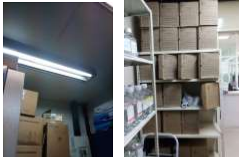
Figura No 27: Documentación de Grupo de Micobacterias Red

Cabe resaltar en total el Grupo de Micobacterias Red por medio de sus depósitos encontrados en el INS conserva 28.25 metros lineales entre las diferentes unidades de conservación