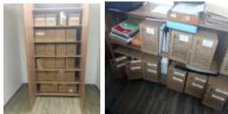
Figura No 41: Documentación del Grupo de Animales de Laboratorio