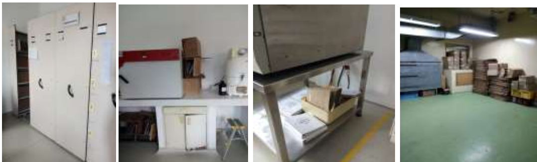
Figura No 40: Documentación del Grupo de Aseguramiento de la Calidad

Cabe mencionar que la Grupo de Aseguramiento de la Calidad en sus depósitos tiene un total de 16.25 metros lineales en documentación.