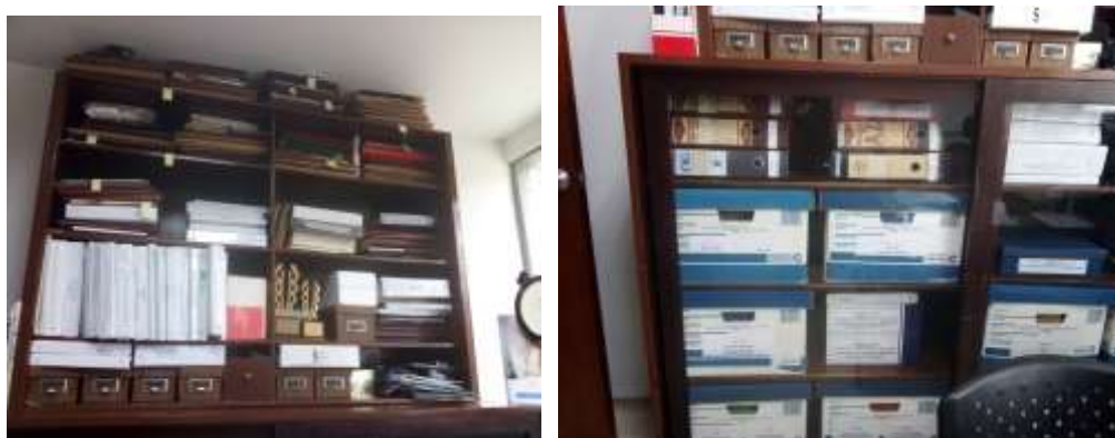
Figura No 14: Documentación del Grupo Parasitología

Nota: Este depósito es compartido con el grupo de Parasitología redes