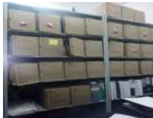
Figura No 16: Documentación de Entomología

Nota: Por último, este depósito es compartido con el grupo de Entomología Redes