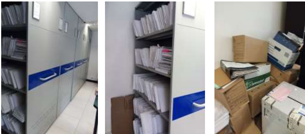
Figura No 8: Documentación del Grupo Talento Humano

El depósito general tiene 5 módulos que miden 12 mts, y la documentación que se encuentra en el piso es de 96 cm de largo por 43 cm de alto y por último el grupo menciona que el depósito cumple con los requisitos mínimos para la conservación y preservación de los documentos. Cabe mencionar que en sus depósitos tiene un total de 63.25 metros lineales en documentación.