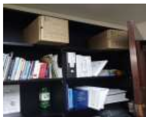
Figura No 30: Documentación de Grupo de Unidad de Casos Especiales- SIVIGILA