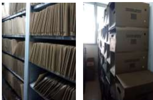
Figura No 32: Documentación de Grupo de Eria y Plaguicidas

depósito son aceptables para mantener los documentos tanto en el aspecto ambiental como físico, pero debería tener más entradas de aire e iluminación para el depósito.