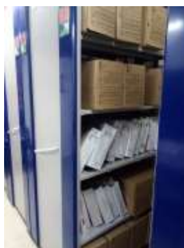
Figura No 20: Documentación de Subdirección Gestión de Calidad de Laboratorios

Nota: Por último, este depósito es compartido con la Dirección de Redes.