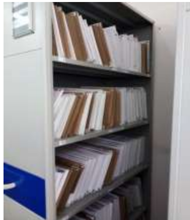
Figura No 8: Documentación del Grupo Gestión Contractual

documentación hace dos años, la documentación presta el servicio de consulta y préstamo para la dependencias del INS, las características del soporte es papel, el depósito cuenta con estantería metálica fija con seis módulos y mueble de madera con 2 entrepaños, le realizan mantenimiento cuando es necesario al estante y por último el grupo menciona que el depósito cumple con los requisitos mínimos para la conservación y preservación de los documentos.