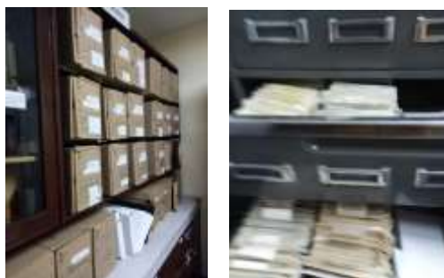
Figura No 18: Documentación de Morfología Celular

Nota. La documentación que se encuentra en el módulo 2 (mueble metálico), es documentación, correspondientes a fotos en blanco y negro que representan los diferentes eventos (enfermedades) de los años 1960 a 1980, los cuales son de consulta por el Investigador inédito, Investigador patólogo pensionado del INS, que todavía realiza diferentes actividades sobres estos temas. Cabe aclarar que el laboratorio del bloque a en el primer piso se encuentra un estante que contiene los negativos de estas fotos (que se encuentran en la oficina) en muy buenas condiciones, no presentan ningún tipo de intervención ni inventario