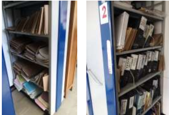
Figura No 21: Documentación de Grupo Red de Donación y Trasplantes de Órganos

mts. Por último, el grupo, señala que las condiciones del depósito no son aceptables para mantener los documentos tanto en el aspecto ambiental como físico, porque necesitan más espacio en donde puedan conservar los documentos.