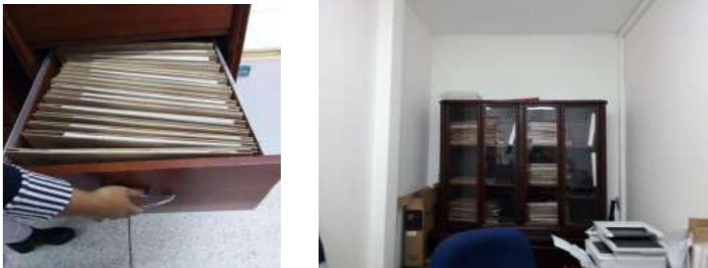
Figura No 5: Documentación de la OCI

En segundo lugar, se realizó diagnóstico a los archivos de gestión de la Secretaria General y cada uno de los Grupos (Grupo de Atención al Ciudadano, Grupo de Gestión Contractual, Grupo de Control Interno Disciplinario, Grupo de Equipos de Laboratorio, Grupo de Gestión Administrativa “ambiental y almacén” y Gestión Financiera “Facturación, Tesorería, Costos, Presupuesto y Contabilidad”)