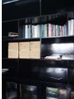
Figura No 33: Documentación de Grupo de Factores de Riesgos Ambientales

Por último, el grupo señala que las condiciones del depósito son aceptables para mantener los documentos tanto en el aspecto ambiental como físico.