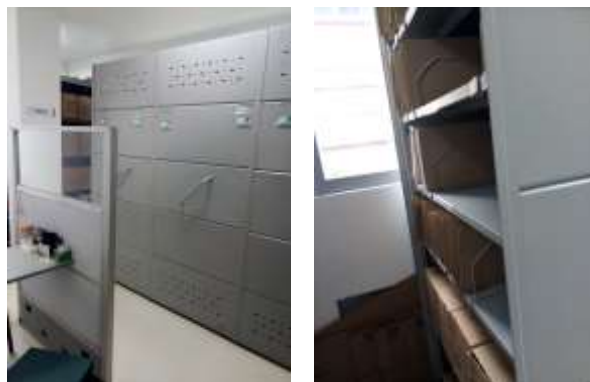
Figura No 23: Documentación de Grupo Parasitología Red