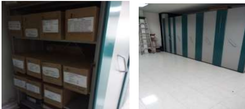
Figura No2: Documentación de la Oficina de las TICs

Los funcionarios mencionan que dentro del Instituto si se encuentra documentación en otra parte en el grupo contractual las hojas de vida, se encuentra separada porque son copias, la documentación presta servicio de consulta solo para la oficina, las características del soporte es papel, el depósito cuenta con 2.62 mts correspondientes a 5 módulos de la estantería. Por lo tanto, la oficina describe las condiciones del depósito como son adecuadas para mantener los documentos, pero le hace falta iluminación.