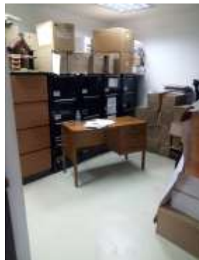
Figura No 13: Documentación de la Dirección de Investigación

En total en la Dirección de Investigación por medio de sus depósitos distribuidos en el INS conserva 12.25 metros lineales, entre las diferentes unidades de conservación