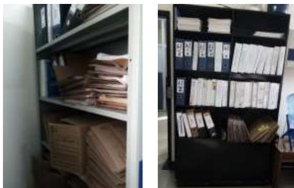
Figura No 25: Documentación de Grupo de Química y Toxicológica Red

Cabe resaltar en total el Grupo de Química y Toxicológica por medio de sus depósitos encontrados en el INS conserva 22 metros lineales entre las diferentes unidades de conservación