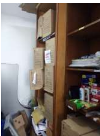
Figura No 10: Documentación del Grupo de Equipos de Laboratorio

El grupo menciona que dentro del instituto no hay documentación fuera del grupo, el responsable del depósito es el referente de calidad, la documentación se encuentra organizada, se ha realizado el descarte de la documentación, el soporte de los documentos es papel, la documentación se encuentra ubicada en un mueble de madera, que presenta las siguientes dimensiones 2.10 por 1.50 mts., por último el grupo señala que las condiciones del área del depósito no son buenas ni aceptables para conservar ni mantener los documentos, que debería existir una estantería y un sitio adecuado para la conservación de documentos.