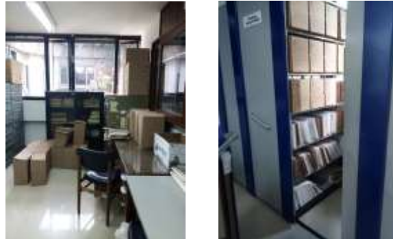
Figura No 26: Documentación de Grupo de Patología Red