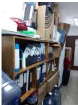
Figura No 20: Documentación de Dirección de Redes