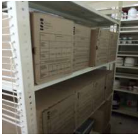
Figura No 16: Documentación de Micobacterias

El depósito tiene la dimensión de 1,33 mts por 1.0 mts. Por último, el grupo señala que las condiciones del depósito son aceptables para mantener los documentos tanto en el aspecto ambiental como físico.