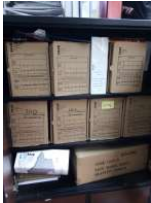
Figura No 7: Documentación del Grupo Atención al Ciudadano

mantenimiento cuando es necesario al estante y por último el grupo menciona que el depósito cumple con los requisitos mínimos para la conservación y preservación de los documentos.