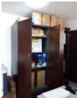
Figura No 9: Documentación del Grupo de Control interno

Menciona que dentro del instituto no hay documentación fuera del grupo, se encuentran documentos arriba del estante por falta de espacio, el responsable es el Técnico que se encuentra en este momento en el grupo, la documentación se encuentra organizada, no se ha realizado descarte, la documentación presta el servicio de consulta, su soporte es papel y CDs, el depósito tiene las siguientes dimensiones 1.90 por 1.50 metros, se le hace mantenimiento al depósito y por último el grupo menciona que el depósito debe contar con estantería adecuada para archivos para la conservación de los documentos.