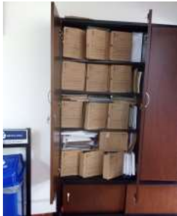
Figura No1: Documentación de la Dirección General

Los funcionarios mencionan que dentro del Instituto Nacional de Salud no se encuentra documentación en otra parte, la persona responsable del archivo es la dirección, la documentación presta servicio de consulta solo para la dirección, el depósito cuenta con 1.50 más x 2.00 mts. Por lo tanto, las condiciones del depósito son adecuadas para mantener los documentos producidos por la dirección en el aspecto físico y ambiental.