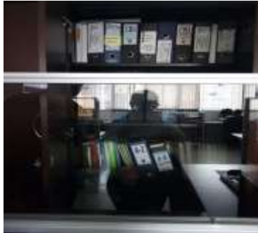
Figura No 36: Documentación de Grupo de Enfermedades Crónicas no Trasmisibles y Grupo de Lesiones de Causa Externa

En sexto lugar, se realizó diagnóstico a los archivos de gestión de la Dirección de Producción en Salud Pública de cada uno los Grupos: Grupo de Producción y Desarrollo Tecnológico (Medios de Cultivo, Planta de Sueros Hiperinmunes), Grupo de Aseguramiento de la Calidad y Grupo de Animales de Laboratorio.