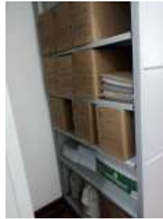
Figura No 6: Documentación de la Secretaría General

Dentro del Instituto no se encuentra documentación en otra parte del INS, las personas responsables del archivo son los auxiliares, la documentación presta servicio de consulta solo para las dependencias del INS, las características del soporte es papel, el depósito cuenta con una estantería metálica fija, le realizan mantenimiento cuando es necesario al estante y por último la secretaria menciona que el depósito cumple con los requisitos mínimos para la conservación y preservación de los documentos.