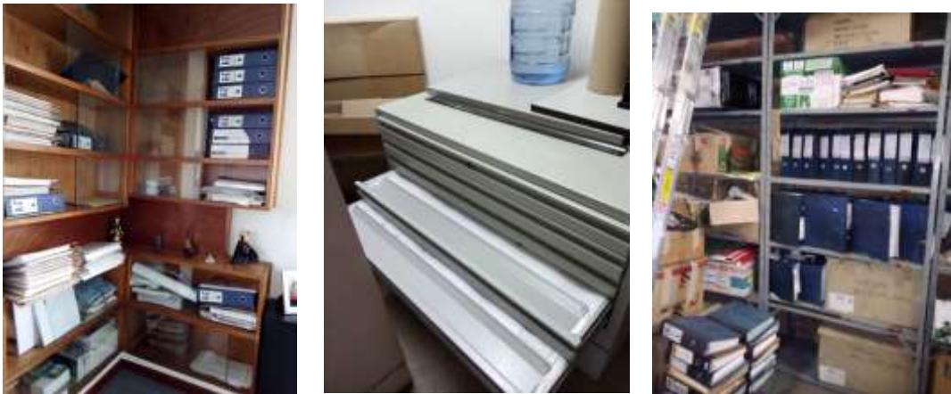
Figura No 11: Documentación del Grupo de Gestión Administrativa