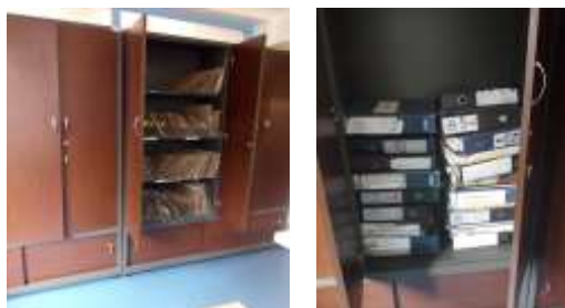
Figura No 22: Documentación de Grupo Bancos de Sangre y Trasfusión

Por último, el grupo indica que las condiciones del depósito son aceptables para mantener los documentos tanto en el aspecto ambiental como físico.