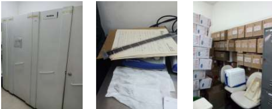
Figura No 25: Documentación de Grupo Genéticas y Crónicas Red

Cabe resaltar en total el Grupo de Genética y Crónicas por medio de sus depósitos distribuidos en el INS conserva 37.75 metros lineales entre las diferentes unidades de conservación