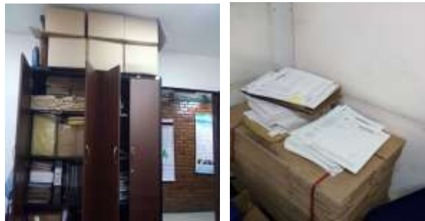
Figura No 35: Documentación de Grupo de Enfermedades Transmitidas por Vectores- ZONOSIS

Nota: Al momento de realizar la vista, la persona encargada de realizar el diagnóstico se percató que tenía cajas encima de estante de un proyecto que contenía demasiado polvo, y que tenía documentación de este proyecto suelto encima de una silla del escritorio. Al observar el estante se identificó que más de la mitad se encuentra desocupado en donde puede ubicar las cajas que se encuentran en la parte de encima del estante.