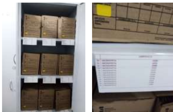
Figura No 17: Documentación de Nutrición

El depósito que se encuentra en el laboratorio tiene una dimensión de 99 cm por 2 mts. Por último, el grupo señala que las condiciones del depósito no son aceptables para mantener los documentos tanto en el aspecto ambiental como físico, debido a que no cuenta con un espacio apropiado para ubicar las cajas, no cuentan con una estantería adecuada.