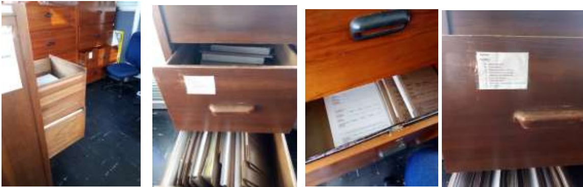
Figura No 42: Documentación del Dirección de Observatorio Nacional en Salud Pública y Grupo de Análisis de Situación en Salud Pública

Por último, la dirección y el grupo señalan que las condiciones del depósito no son aceptables para mantener los documentos tanto en el aspecto ambiental como físico. Debido a que les hace falta acceso estantería, extintores de humo, detectores de humo y las demás condiciones para conservar los documentos.