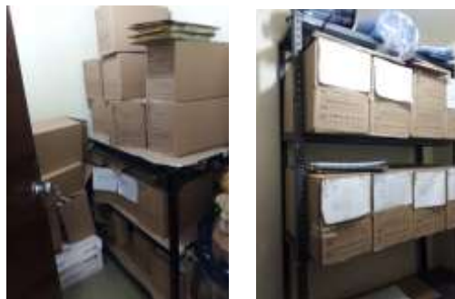
Figura No 37: Documentación de la Dirección de Producción

Cabe mencionar que la Dirección de Producción en sus depósitos tiene un total de 9 metros lineales en documentación.