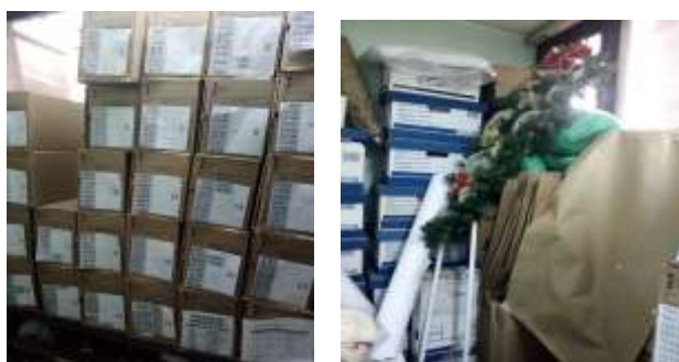
Figura No 17: Documentación del Fisiología Molecular

El depósito tiene la dimensión de 2,60 mts por 2.0 mts., por último, el grupo señala que las condiciones del depósito no son aceptables para mantener los documentos tanto en el aspecto ambiental como físico debido a que es muy angosto, incómodo para moverse dentro del espacio, necesita muebles de archivo, ventilación apropiada y la iluminación necesaria.