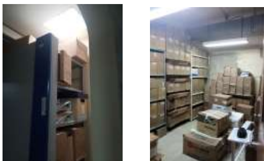
Figura No 28: Documentación de Grupo de Microbiología Red

Cabe resaltar en total el Grupo de Microbiología Red por medio de sus depósitos encontrados en el INS conserva 79.75 metros lineales, entre las diferentes unidades de conservación