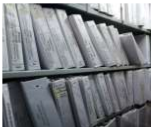
Figura No3: Documentación de la Oficina de Planeación

de la estantería. Por lo tanto, la oficina describe las condiciones del depósito en donde se encuentra suministros que no hacen parte del depósito, ventilación e iluminación apropiada para el depósito.