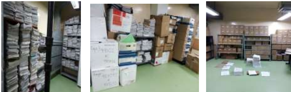
Figura No 29: Documentación de Grupo de Virología Red

Cabe resaltar en total el Grupo de Virología Red por medio de sus depósitos encontrados en el INS conserva 272.75 metros lineales entre las diferentes unidades de conservación