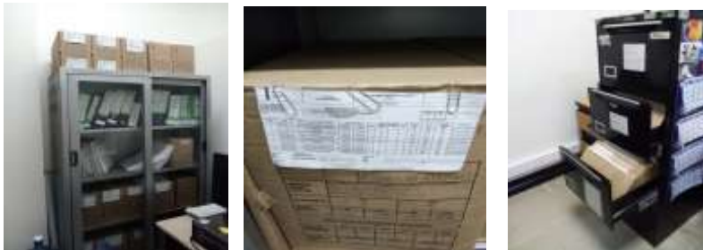
Figura No 38: Documentación del Grupo de Producción y Desarrollo Tecnológico - Medios de Cultivo

Cabe mencionar que la Grupo de Producción y Desarrollo Tecnológico - Medios de Cultivo en sus depósitos tiene un total de 14.75 metros lineales en documentación.