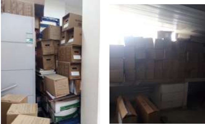
Figura No 12: Documentación del Grupo de Financiera

En tercer lugar, se realizó diagnóstico a los archivos de gestión de la Dirección de Investigación en Salud Pública y cada uno los Grupos (Grupo de Salud Ambiental y Laboral, Grupo de Parasitología, Grupo Salud Materna y Perinatal, Grupo de Microbiología, Grupo de Micobacterias, Grupo de Entomología, Grupo Fisiología Molecular, Grupo de Nutrición, Grupo de Morfología Celular y Grupo de Biblioteca).