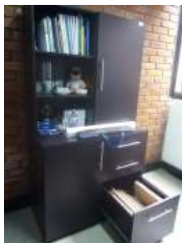
Figura No 20: Documentación de Subdirección Nacional de Laboratorios de Referencia