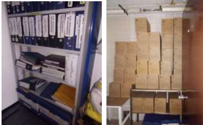
Figura No 15: Documentación del Microbiología